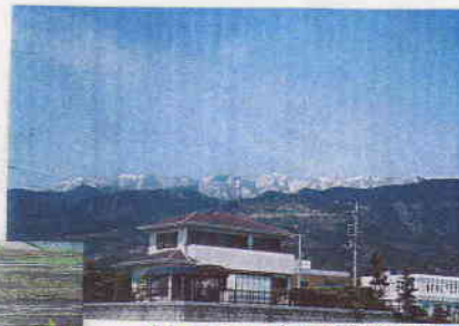
4/9 朝日に輝く丹沢山地。

お元気ですか!! 私もピカピカの新年生と日時 を同じくして 農にめざめ, 農を始めました。 これからの年, ひたすらにがんばります。