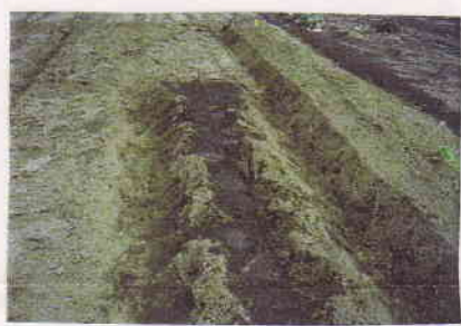
そしてじゃがいもの植え付け