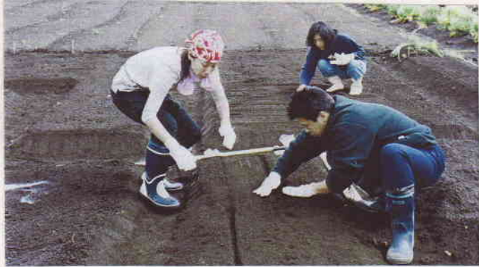
4/8(日) 早速畝区けつけてくれた 援農人, ありがとう!! (たすけびと)