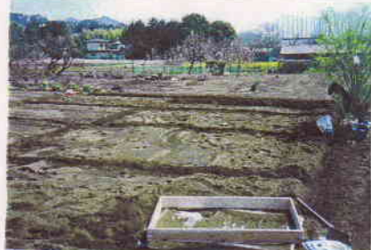
堆肥場とスリ, 区画割り, .....