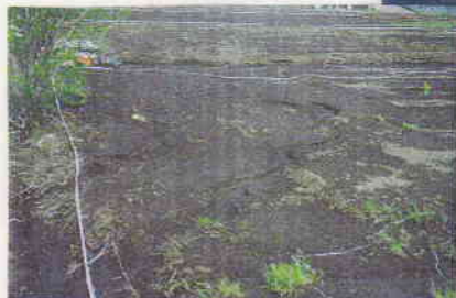
前日の雨でえぐれた畑。