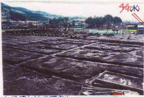
まず、基本的区画割。