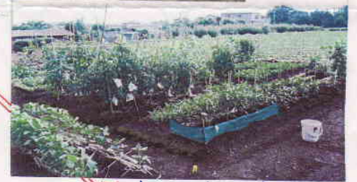
7/20. 育てていくからで、今はこのまま。