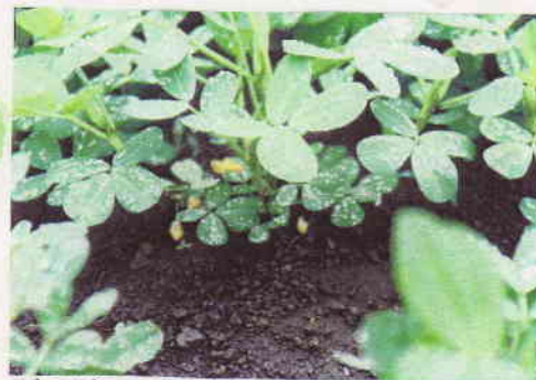
落花生の開花 (ある日の雨上がりに)