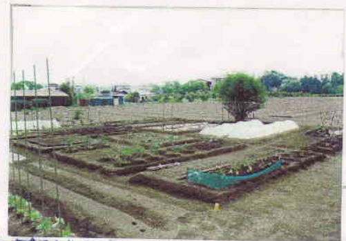
少しずつ植え付け。