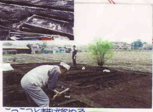
こつこつと耕し始める……