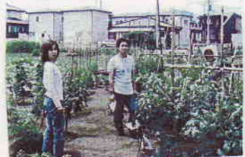
6/2(日). 2nd. 援善の夫婦夫婦