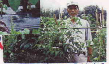
充分稼げて満足している“おれ”