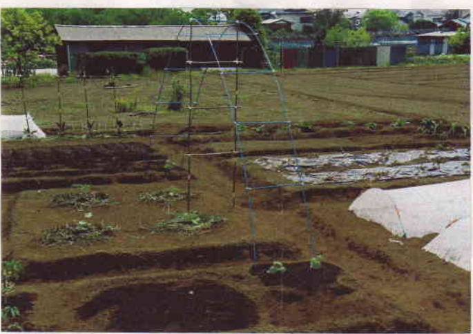
今は影のうすい『中央ア・子』

秦野 菩提のmy畑にします。ひばりのさえずりを聞きながら、ハイブ椅子に座って「我びりたち」を見守っています。至福のひと時です。