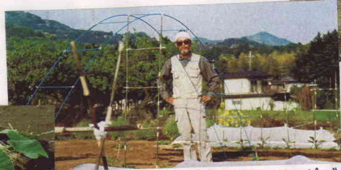
中央ア・子でいつものポーズ!!