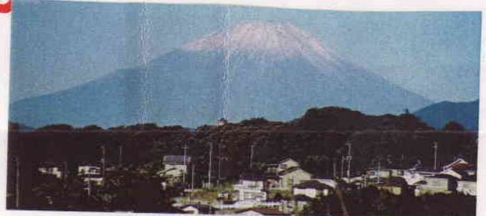
初冠雪の富士山(秦野から)