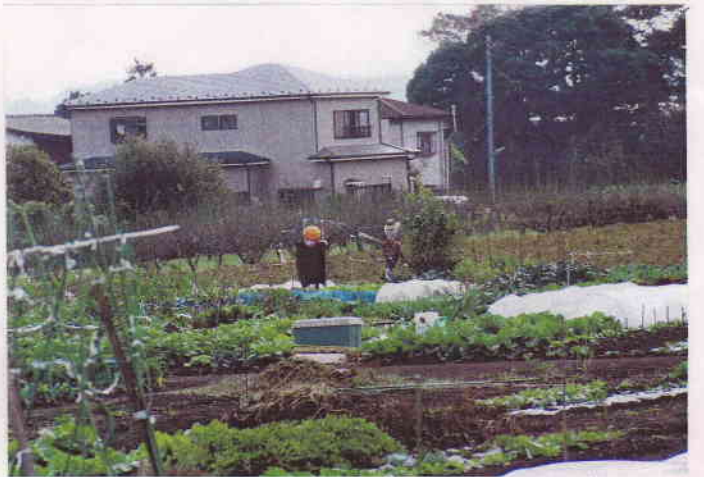
じっくりと育てる"かんし" 2体?