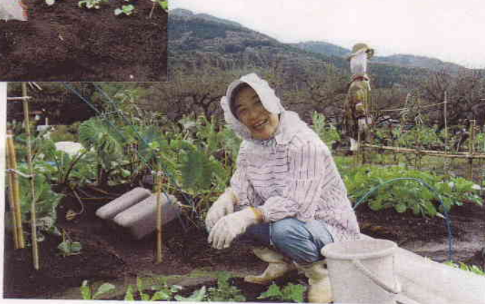
だいこんの間引き