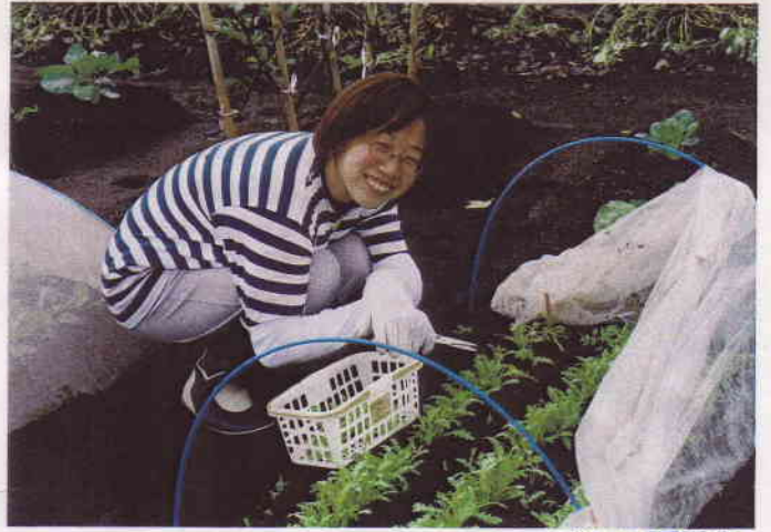
しんきくの間引き