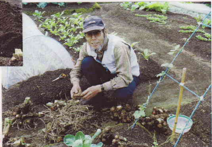
おお...!! ちんちん出来るぞ!