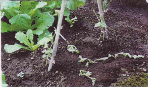
みず菜の植え付け