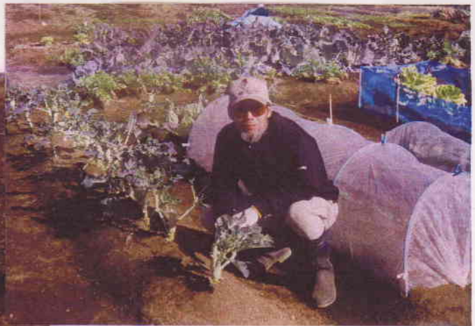
そいつある日のおれ