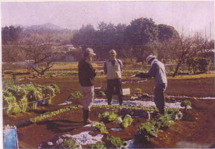
12/27(土)小泉おじさんの巡回指導。

至福の亥も過ぎしはがら、まわしても 「遊び心をもったニューのらん」を目指します。